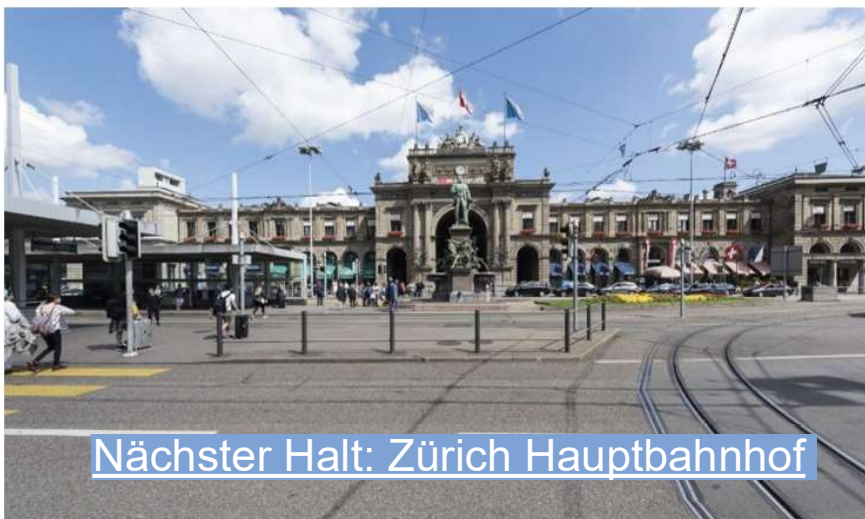
Nächster Halt: Zürich Hauptbahnhof

Sie kennen den Zürich Hauptbahnhof von Zugfahrten oder vom Einkaufen. Doch haben Sie sich schon gefragt, was sich hinter seinen Kulissen abspielt? Unsere Führung liefert Ihnen Antworten.